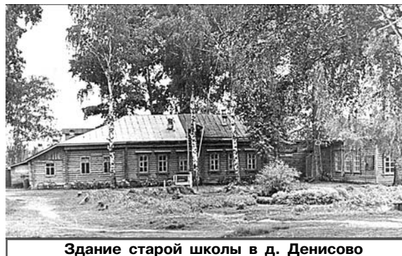
Здание старой школы в д. Денисово