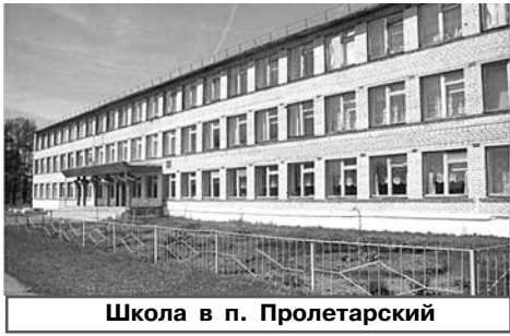
Школа в п. Пролетарский