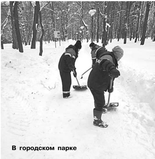
В городском парке