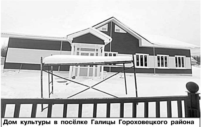
Дом культуры в посёлке Галицы Гороховецкого района

В рамках регионального проекта «Культурная среда» профильного нацпроекта в минувшем году был построен Дом культуры в посёлке Галицы Гороховецкого района. В этом году после благоустройства территории его введут в эксплуатацию. В Вязниках начато строительство Центра культурного развития, оно будет завершено в 2024 году;