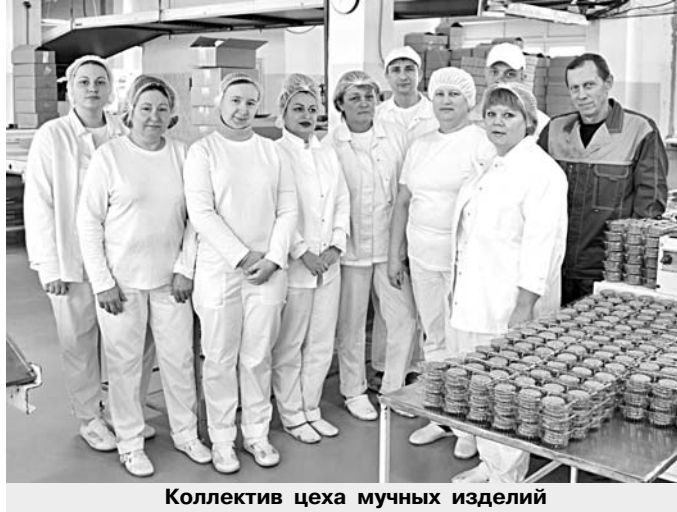
Коллектив цеха мучных изделий

Ежегодно выставка проходит при поддержке Министерства сельского хозяйства России и под патронатом Торгово-промышленной палаты РФ. Здесь представлено продовольствие со всего мира: от базовых продуктов и напитков до изысканных деликатесов, а также органическое, спортивное питание для здорового образа жизни.