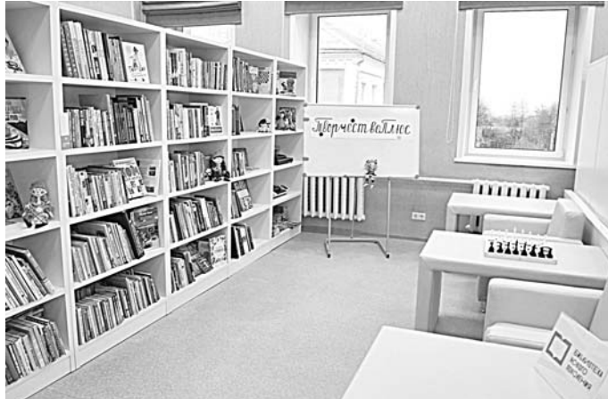
Один из обновленных читальных залов Юрьев-Польской районной библиотеки

Материалы предоставлены Управлением массовых коммуникаций Администрации Губернатора Владимирской области