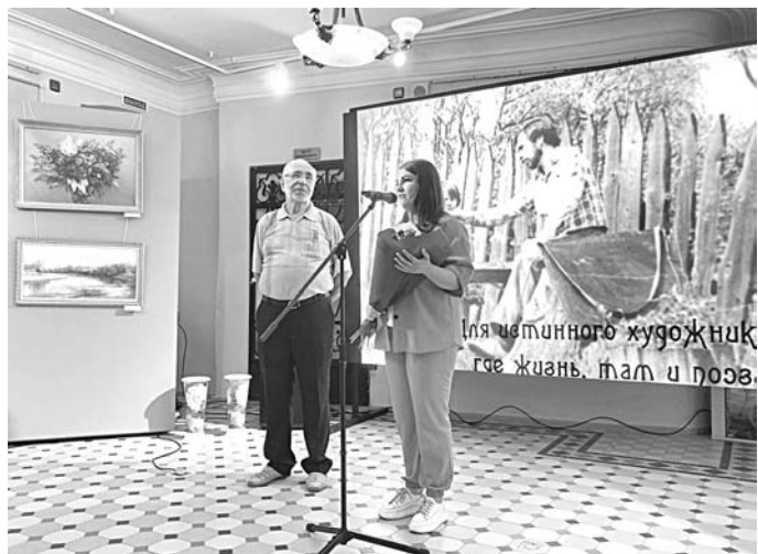
На персональной выставке в июле 2023 года

Картины художника разъехались по городам Нижегородской и Владимирской областей, уехали в Москву и даже