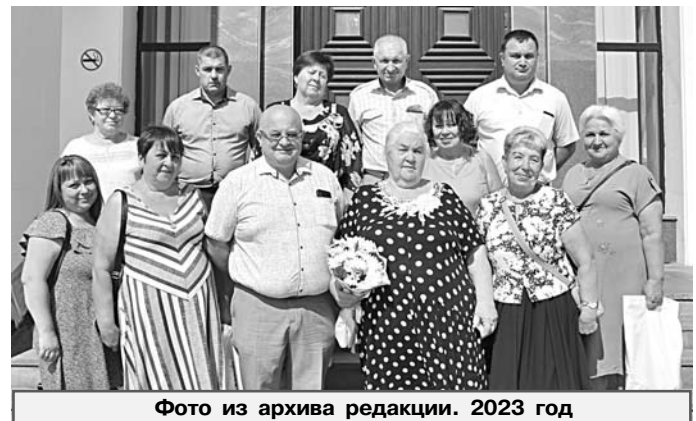
Фото из архива редакции. 2023 год

При рассмотрении заявок будет учитываться информирование жителей о социально значимых мероприятиях, проведение встреч и сходов граждан, участие в мероприятиях, направленных на создание благоприятных условий в сельском населённом пункте и профилактику первичных мер пожарной безопасности и правонарушений, участие в воспитательной работе с детьми и подростками, организация культурно-массовых мероприятий и даже наличие наград и публикаций в СМИ и соцсетях.