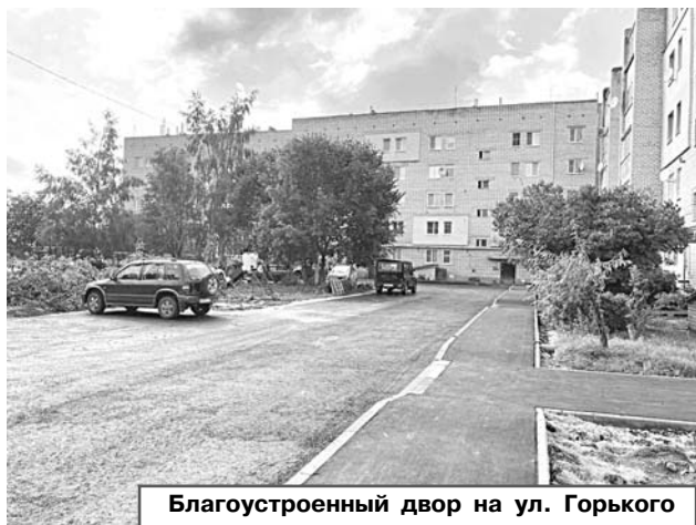
Благоустроенный двор на ул. Горького

получили сертификаты на покупку жилья. В 2024 году запланировано выдать четыре сертификата.