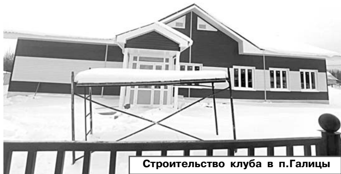
Строительство клуба в п. Галицы

Отмечу, многое зависит от объема средств, который выделит область. До 15 февраля все документы с Министерством должны быть подписаны.