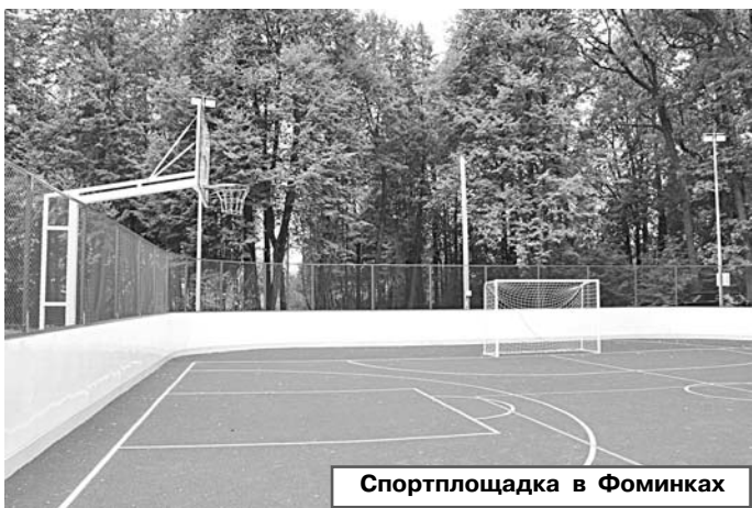
Спортплощадка в Фоминках

В 2024 году планируем выполнить ремонт 5,34 км дорог. Плановая сумма средств – около 34 млн руб. В МО Куприяновское – это участки дорог в д. Ве-