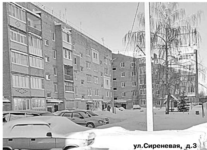
ул. Сиреневая, д. 3

Минстрой России в конце года выступил с предложением изменить очередность проведения капремонта МКД. Поскольку по большей части он проводится согласно нормативным срокам, а не исходя из реального износа зданий, то в результате иногда ремонт делают в зданиях, где он особо и не требуется, а дома в критическом состоянии ждут своей очереди. Поэтому очередность проведения работ нужно принимать, учитывая реальный износ дома, считают в Минстрое. Для определения необходимости капремонта следует проводить технический учет зданий и оценивать физическое состояние конструктивных элементов. Новые подходы к капремонту планируется заложить в проект Стратегии развития ЖКХ РФ на период до 2035 года, который передан в правительство в конце 2023 года.