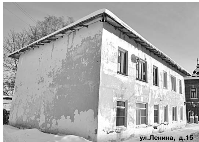
ул. Ленина, д. 15