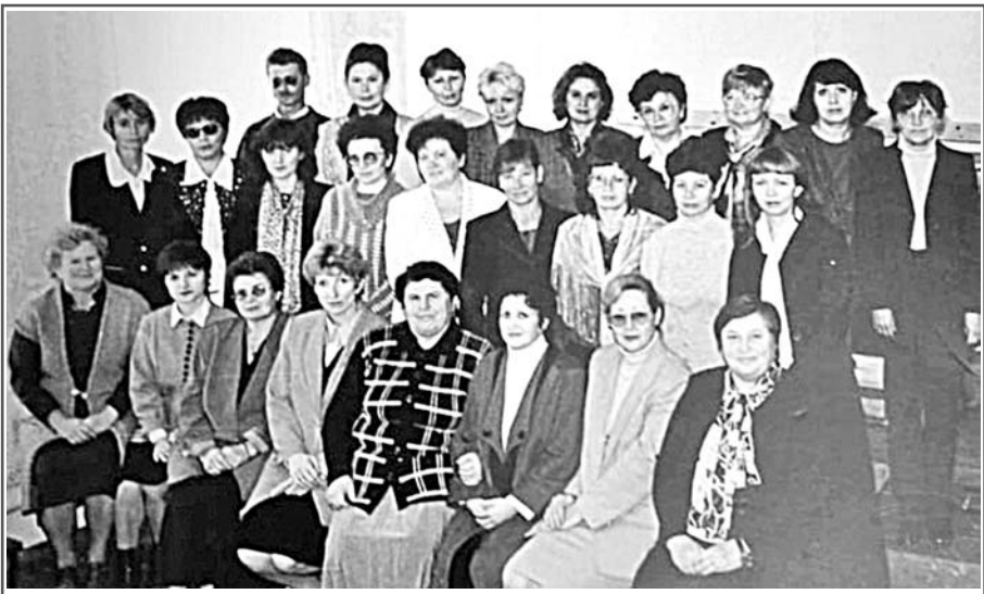
Педагоги района. Конец 90-х - начало 2000-х