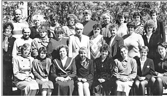
Коллектив школы № 5