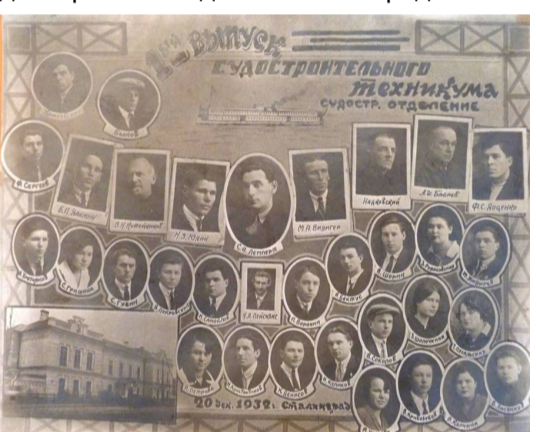
Выпускники Судостроительного техникума г. Сталинград, 1932 г.

В электронном архиве нашей библиотеки есть старое фото. На нем запечатлены лица выпускников судостроительного техникума судостроительного отделения, окончивших это учебное заведение 20 декабря 1932 года в г. Сталинград. Вспомните!