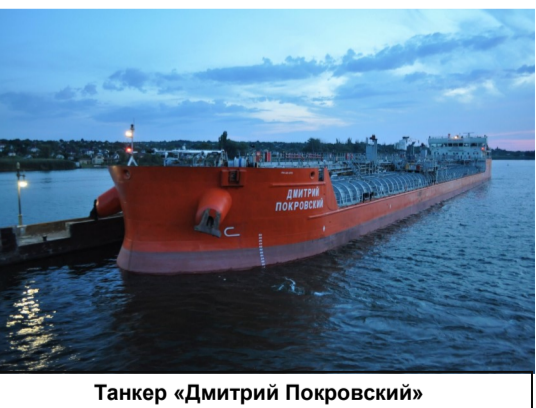
Танкер «Дмитрий Покровский»