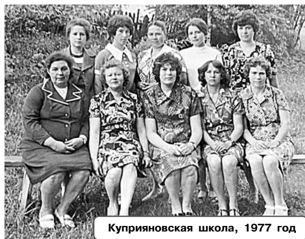
Куприяновская школа, 1977 год