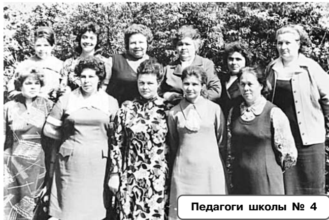
Педагоги школы № 4

В сельских школах района педагогические коллективы были более стабильными, «устойчивыми», педагоги менялись, главным образом, по естественным причинам и вынужденным обстоятельствам. Изменения в экономической политике государства, тенденции в сельском хозяйстве, миграционное движение населения, демографические проблемы и появление школьного транспорта привели к изменениям в структуре районной системы образования: укрупнению средних школ, закрытию начальных, а потом и неполных средних, изменению статуса Чулковской СОШ. Но в памяти местных жителей сохранились и названия