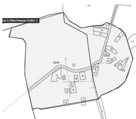
Схема территории подлежащей проектированию

Приложение к техническому заданию на оказание на оказание по разработке проекта планировки территории д. Хорошево Гороховецкого района