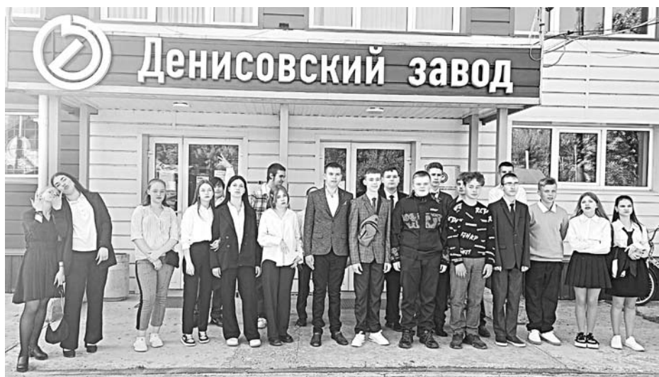
Учащиеся 8 и 9 классов Денисовской СОШ с профориентационной экскурсией посетили АО «Денисовский завод»

Целью введения профминимума является формирование единого профориентационного пространства в системе общего образования РФ. Он призван обеспечить готовность выпускников школ к профессиональному самоопределению. Это должна быть системная работа, в которую вовлекаются не только школы, но и профессиональные образовательные организации, семья