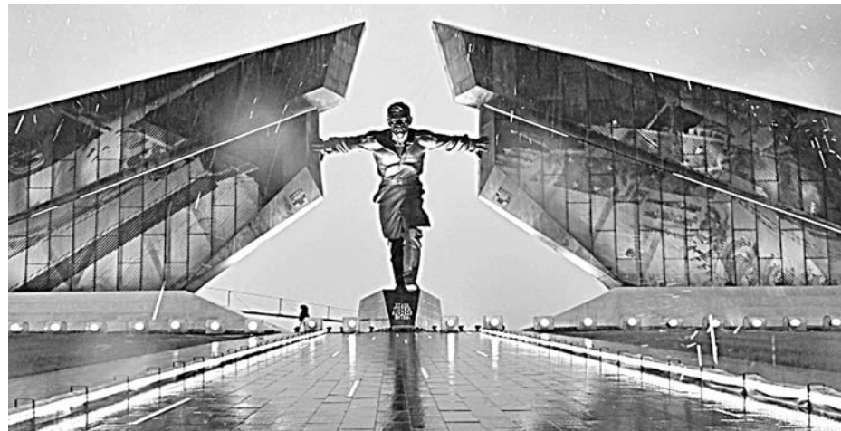
23 августа 2023 года к 80-летию победы в битве на Курской дуге был открыт Мемориальный комплекс «Курская битва», в центре композиции советский воин, который не дает сомкнуться двум надвигающимся стенам с изображениями немецкой техники

Курская битва, длившаяся более 50 дней (с 5 июля по 23 августа 1943 года) показала несгибаемость духа, величайшее мужество и героизм советского солдата. Вот как об этом писала газета «Колхозная жизнь», подшивки которой хранятся в районном архиве. «По предварительным и неполным данным наши войска на Орловско-Курском и Белгородско-Курском направлениях за два дня боев 5 и 6 июля подбили и уничтожили 1019 немецких танков. В воздушных боях и зенитной артиллерией за эти два дня сбито 314 самолетов противника. 6 июля взято в плен 22 немецких летчика... 6 июля на одном участке Орловско-Курского направ-