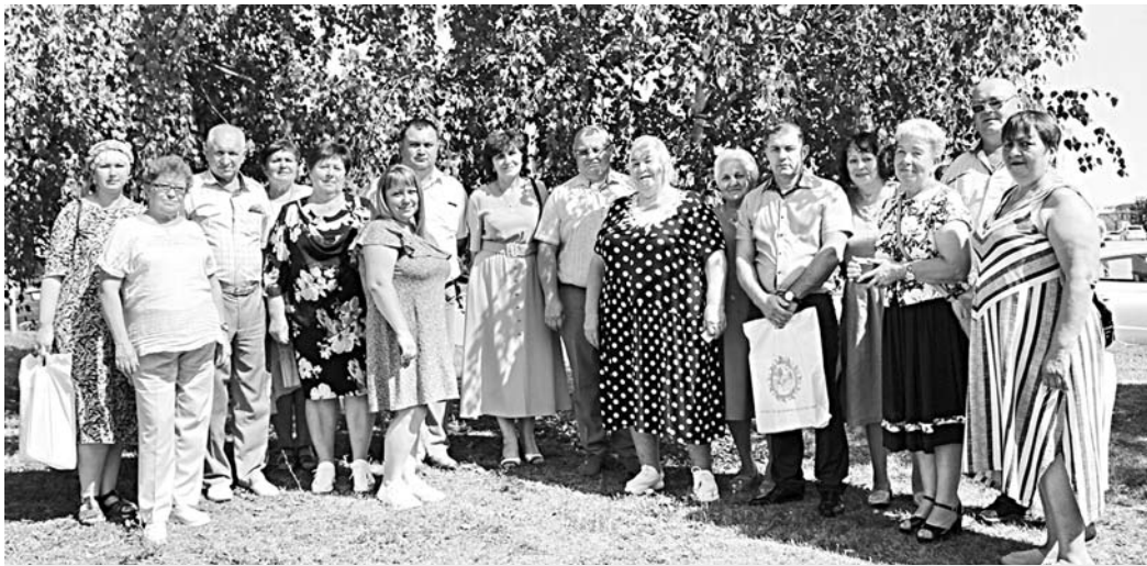
В областном Дне сельского старосты приняла участие делегация Гороховецкого района

А в следующем году в регионе будет запущен новый конкурс на лучшего сельского старосту – «Важные дела Владимирской деревни». Его победители получат денежные призы, а сельское поселение, к которому относится староста, – средства на решение местных вопросов. Этим же целям будет способствовать областная Ассоциация сельских старост: она объединит лидеров села для улучшения взаимодействия с местной и областной властью. Губернатор поддержал данную общественную инициативу.