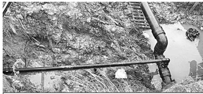
Модернизация сетей в г.Гороховец. Фото из архива редакции, 2022 год