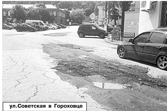
ул.Советская в Гороховце

Гороховецкому району из этой суммы досталось 14,22 млн руб. А всего в 2023 году в рамках муниципальной программы «Модернизация объектов коммунальной инфраструктуры на территории МО Гороховецкий район в 2022-2024 годах» на текущий год запланировано выполнение мероприятий на общую сумму 16,34 млн руб.