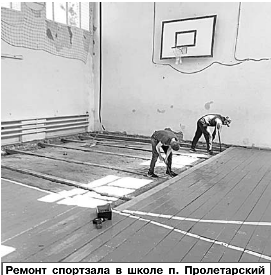
Ремонт спортзала в школе п. Пролетарский