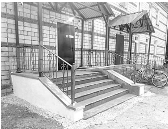
Отремонтированное крыльцо в ДОУ с.Фоминки