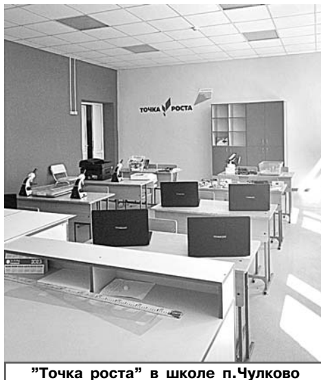
«Точка роста» в школе п.Чулково