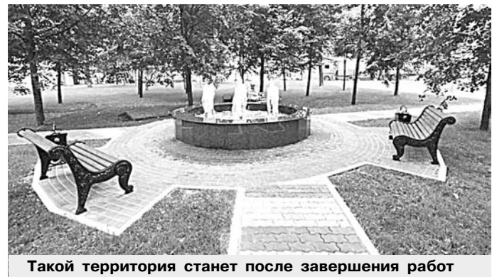
Такой территория станет после завершения работ