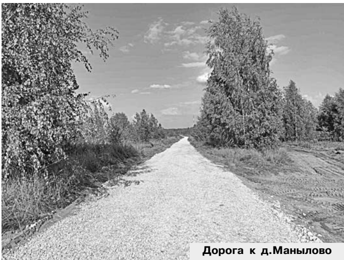
Дорога к д.Манылово

Кстати, этот подрядчик выиграл торги по ремонту пяти объектов в районе в этом году. Сейчас он завершает работы в п. Чулково на участке от дома № 5 по ул. Производственная до пересечения с ул. Луговая (второй участок в поселке Чулково на ул.Полевая ремонтировало ДРСУ). Отремонтированные ООО «Стройтайм+» дороги в д. Быкасово и п. Галицы (к школе) уже приняты.