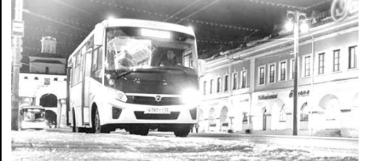
График работы обговаривается при трудоустройстве. Наша компания предлагает Вам достойную заработную плату, официальное трудоустройство согласно ТК РФ, а также новые автобусы. Иногородним предоставляется жилье! Будем рады увидеть новых сотрудников в нашем дружном коллективе!

В город Владимир в связи с расширением парка, транспортная компания ООО «Виктория» приглашает на работу: - ВОДИТЕЛЬ городского автобуса - з/п от 62000 рублей - КОНДУКТОР автобуса - з/п от 35000 рублей - Телефон отдела кадров: 8 (4922) 77-91-00, 8-920-916-67-89