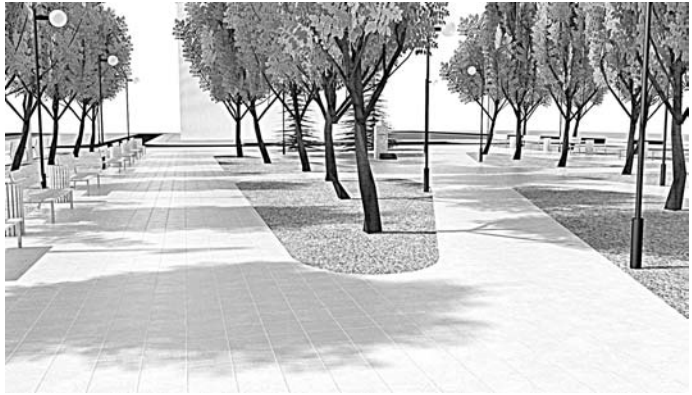
Гороховец в цвету