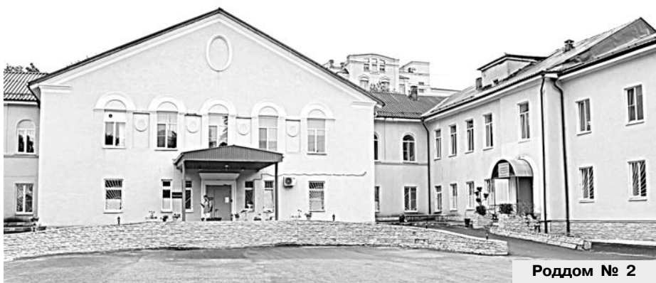
Роддом № 2

В области внедрена новая мера соцподдержки семей с детьми. Она коснется всех малышей, рожденных с 1 октября 2023 года. Родителям предоставлен выбор – взять набор различных предметов ухода на первые недели жизни ребенка или заменить его на деньги – 10 тыс. руб.