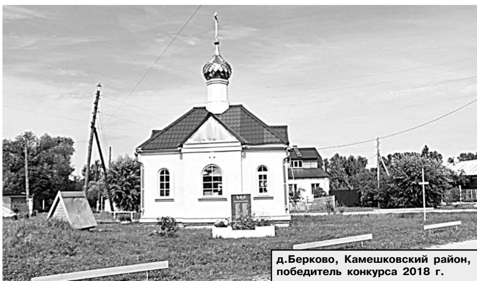
д.Берково, Камешковский район, победитель конкурса 2018 г.