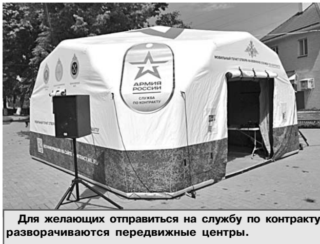
Для желающих отправиться на службу по контракту разворачиваются передвижные центры.

Военный комиссариат Владимирской области направляет в Министерство социальной защиты населения области списки тех, кто имеет право на указанную меру поддержки. Выплата будет предоставляться в беззаявительном порядке на основании списков военкомата.