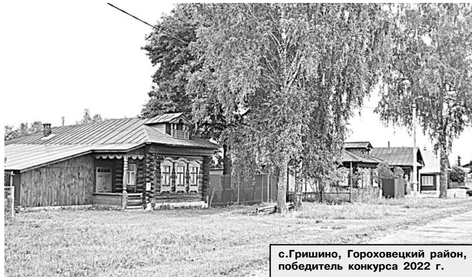
с.Гришино, Гороховецкий район, победитель конкурса 2022 г.

Глава региона подчеркнул, что развитие села является государственной задачей. Большое внимание уделяется повышению качества жизни на селе, развитию агропромышленного комплекса, поддержке фермеров. В 2023 году на развитие сельского хозяйства области направлено 1,6 млрд рублей. В прошлом году по программе комплексного развития сельских территорий было реализовано 47 проектов благоустройства. В этом году планируется благоустроить ещё 14 общественных пространств. В регионе строят и ремонтируют сельские