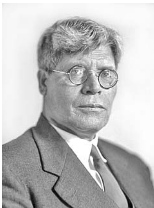
Академик Иван Михайлович Губкин (1971-1939)