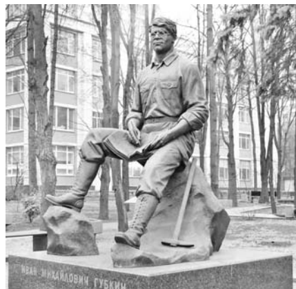
Памятник академику И.М. Губкину возле РГУ нефти и газа