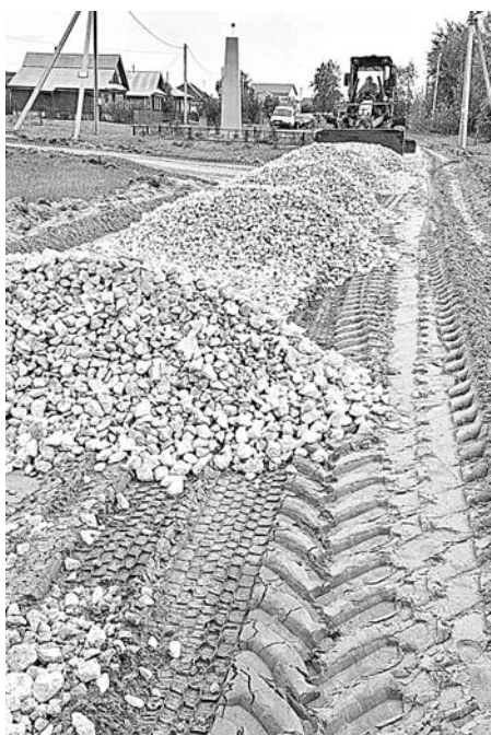
д. Быкасово, ул. Садовая-Новая Линия