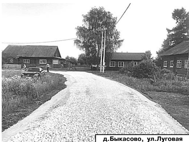
д. Быкасово, ул. Луговая