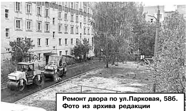
Ремонт двора по ул.Парковая, 58б.

Прием заявок от жителей МКД на выполнение работ по благоустройству осуществлялся в марте и сентябре прошлого года. Поступило четыре заявки: ул. Гагарина