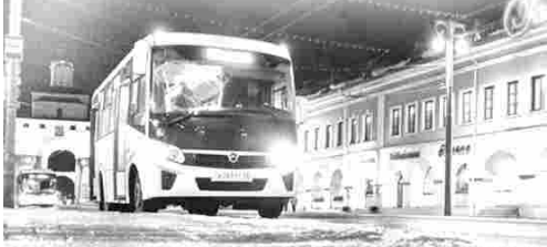
График работы обговаривается при трудоустройстве. Наша компания предлагает Вам достойную заработную плату, официальное трудоустройство согласно ТК РФ, а также новые квартиры. Иногородным предоставляется жилье!

- Телефон отдела кадров: 8 (4922) 77-91-00, 8-920-916-67-89