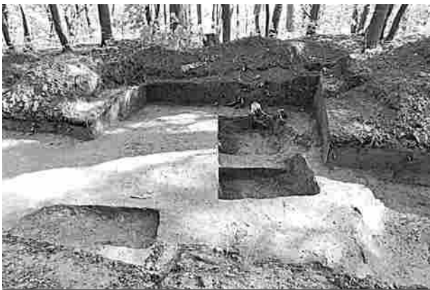
Раскопки в Городском парке, 2020 год

Можно предположить, что курганы на Пужаловой горе появились на 200 лет раньше, чем Гороховец, а пришедшие на эти земли славяне продолжили захоронения. А вдруг Гороховец основан славяно-мерянами, он старше как минимум на два столетия и его возраст уже давно перевалил за 1000 лет? В любом случае,