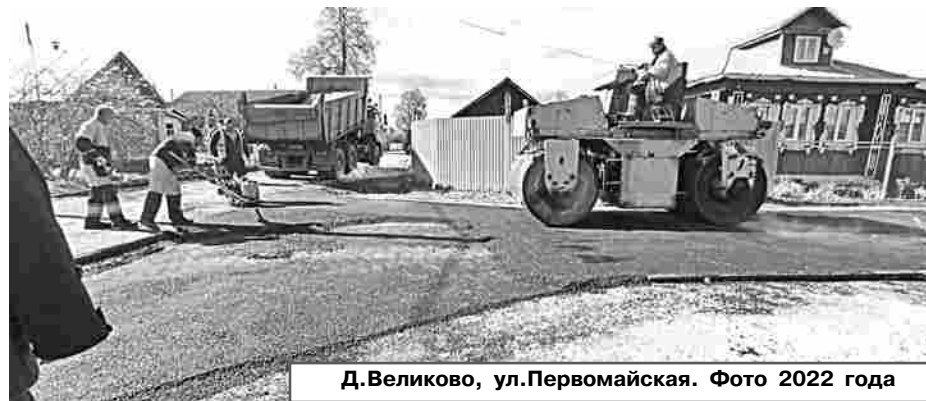
Д.Великово, ул.Первомайская. Фото 2022 года