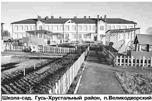
Школа-сад. Гусь-Хрустальный район, п.Великодворский

• Запланировано 114 профильных смен различной направленности, в них примут участие более 16 тыс. детей. Причем доля родительской платы за путёвку в лагерь не может превышать 20 процентов, остальное – компенсируется из бюджета. При этом родители вправе подать заявление на любой лагерь из реестра, который размещён на сайте областного министерства образования и молодежной политики.