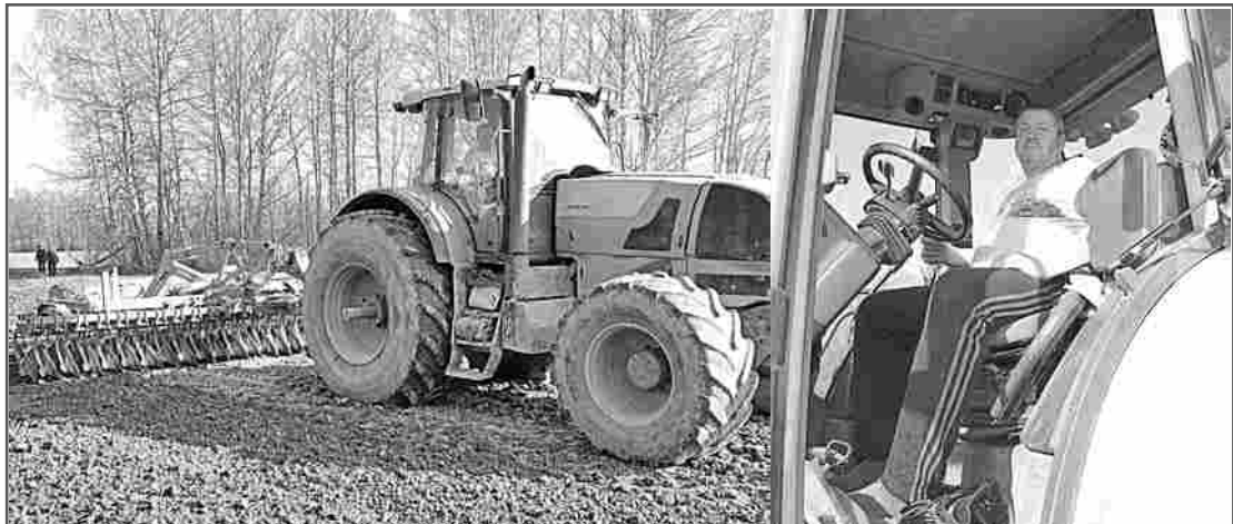
В.П.Болдов на тракторе «Атлес» дискует землю под сев яровых культур – 55 гектаров за рабочую смену.