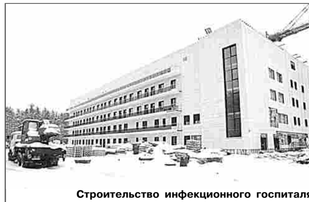
Строительство инфекционного госпиталя

Уже выполнены основные строительные-монтажные работы. Была задержана поставка модульной котельной: ждали её в ноябре-декабре прошлого года, но она поступила только в этом. И теперь сдача объекта привязана к весеннему периоду, когда смонтируют котельную и закончится благоустройство территории.