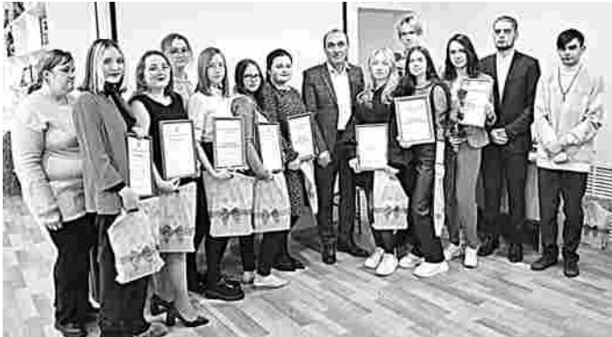
«Добровольцы Гороховецкого района»

Благодарим отдел культуры и молодежной политики администрации района за помощь в подготовке материала.