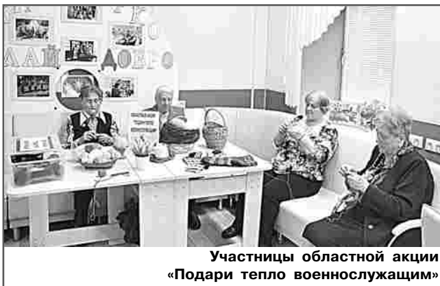
Участницы областной акции «Подари тепло военнослужащим»

При реализации проекта возникают определённые сложности, но они во многом связаны с санкционным давлением, удорожанием стройматериалов и