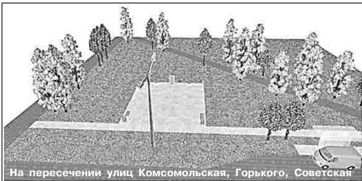
На пересечении улиц Комсомольская, Горького, Советская