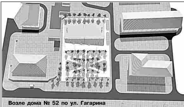
Возле дома № 52 по ул. Гагарина