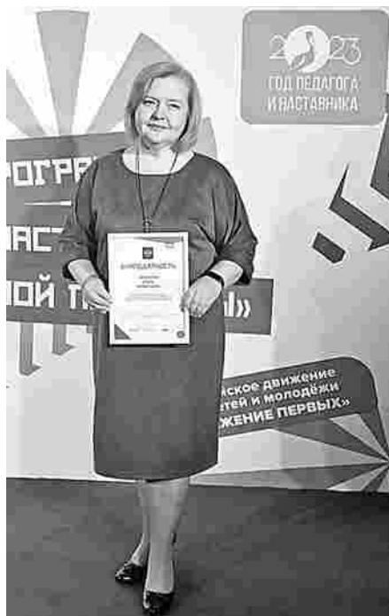
Всероссийский конкурс «Большая перемена» – проект Федерального агентства по делам молодежи (Росмолодежь).

В Крыму завершилась образовательная программа для победителей третьего сезона всероссийского конкурса «Большая перемена». Педагоги-наставники на протяжении недели получали новые знания и делились опытом. В этот раз программа приурочена к Году педагога и наставника в Российской Федерации.