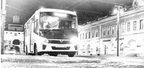
График работы обговаривается при трудоустройстве. Наша компания предлагает Вам достойную заработную плату, официальное трудоустройство согласно ТК РФ, а также новые автобусы. Иногородным предоставляется жилье!

- Телефон отдела кадров: 8 (4922) 77-91-00, 8-920-916-67-89