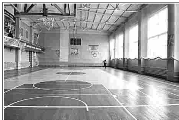
Проведены противоаварийные работы в РДЮФСК. Спорткомплекс возобновил работу