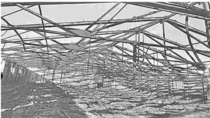
В таком виде дворы были до проведенных работ

Полностью готов к работе молочный блок и другие помещения с техническим оборудованием. Кабинеты для персонала фермы не только отремонтированы, в них установлены пластиковые окна и двери, смонтирована система отопления. Осталось лишь по-