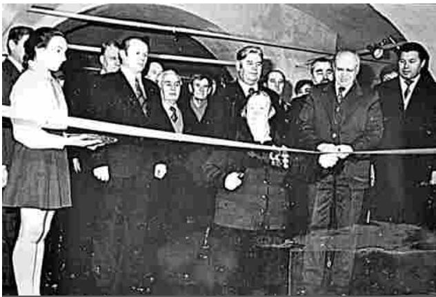
Торжественное открытие музея, 1972 год