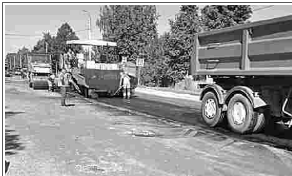
В 2022 году отремонтировано около 8 км дорог в городе и районе