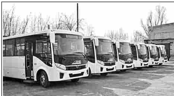
28 апреля на маршруты в городе и по району вышли новые автобусы ПАЗ