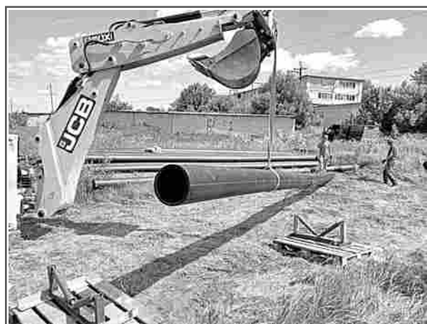
По программе модернизации заменено почти 3,5 км водопроводных сетей