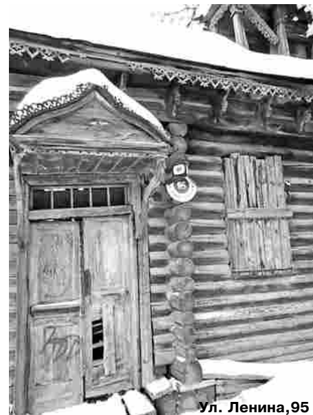
Ул. Ленина, 95

территорией, летом проводить окос травы (последняя не должна вырастать выше 15 см). Если в доме не живут или он брошен, то это не значит, что хозяевам домовладения не надо поддерживать порядок на собственной территории. Власть следит за этим. Например, нашли же хозяев домов