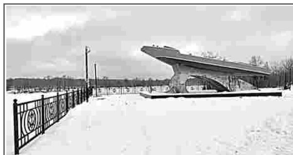
В рамках благоустройства набережной установлен памятник мотоботу, который выпускал судостроительный завод в годы Великой Отечественной войны