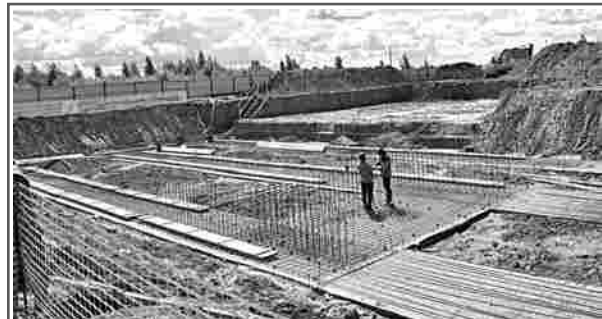
На Новой линии в Гороховце началось строительство нового здания отделения полиции