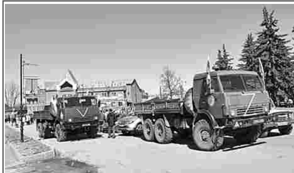
20 апреля Гороховецкий район присоединился к Всероссийской патриотической акции «Вместе» в поддержку специальной военной операции