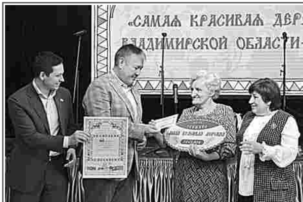
Село Гришино стало обладателем Гран-при конкурса «Самая красивая деревня Владимирской области»