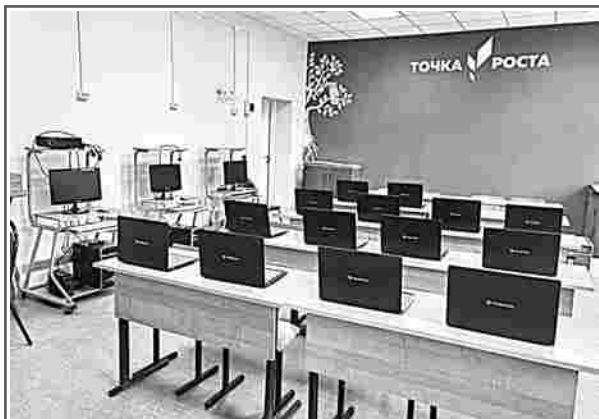
В Фоминской школе открылся Центр образования естественно-научной и технологической направленностей «Точка роста»