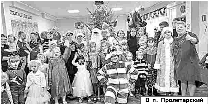
В п. Пролетарский

25 декабря в Галицком клубе состоялся театрализованный новогодний праздник «Как Дед Мороз валенки поте-