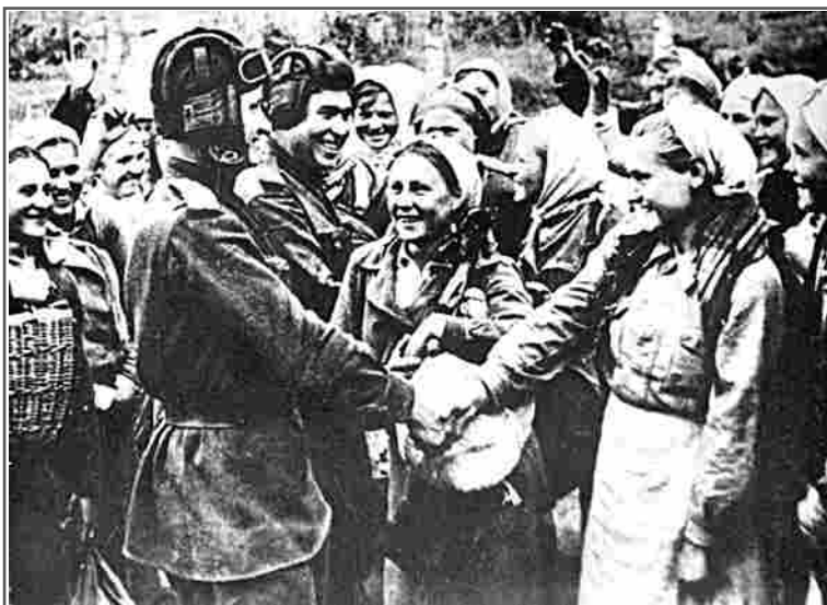
Девушки приветствуют советских офицеров-танкистов на Украине