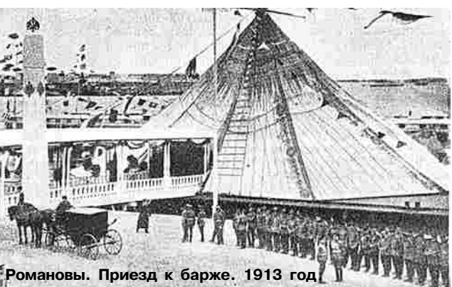
Романовы. Приезд к барже. 1913 год

ный завод. В 1925 г. выпускались баржи, пароходы, землеотвозные шаланды, в 1927 – упоминаются сухогрузные баржи. Структура предприятия в 1925 году: завком, механическая мастерская, котельный цех, кузница, лесопилка, место для токарных работ, разбивочный плац, материальный склад. В статье от 9 января 1925 г. указано число рабочих – 200 человек, количество зависело от сезона. Автор статьи в газете «Призыв», скрытый под псевдонимом «Л. Скиталец», описал структуру завода, раскрыл детали. Довольно живописно показал процесс клёпки: «Железными руками, напрягая все усилия, дубасит «глухарь» по заклёпке. Глухие удары разносятся далеко, вызывая из-за реки ответное эхо».