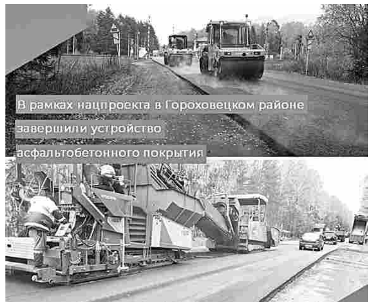
В рамках нацпроекта в Гороховецком районе завершили устройство асфальтобетонного покрытия