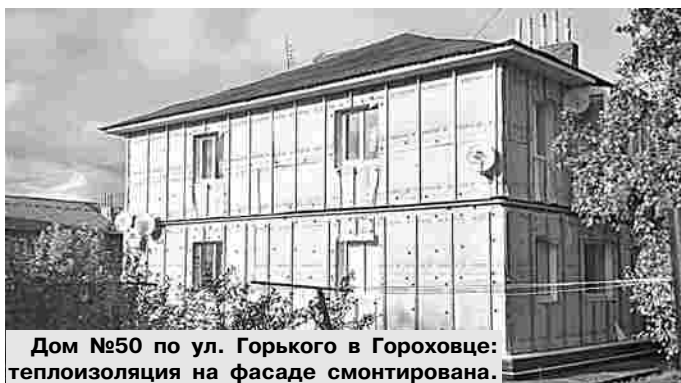
Дом №50 по ул. Горького в Гороховце: теплоизоляция на фасаде смонтирована.