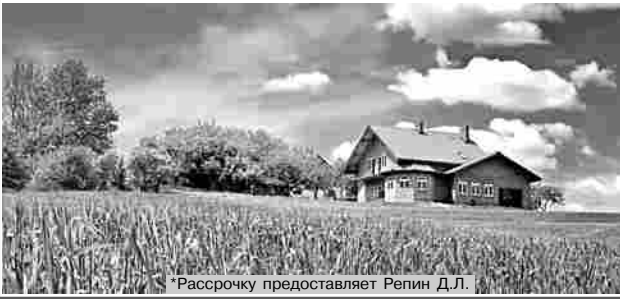
*Рассрочку предоставляет Репин Д.Л.