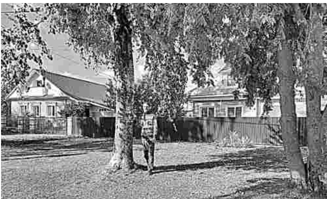
...самым неожиданно приятным стали виды на нарядные костюмы и платья с кисточками богато украшенных оранжево-красным цветом кистей рябин...