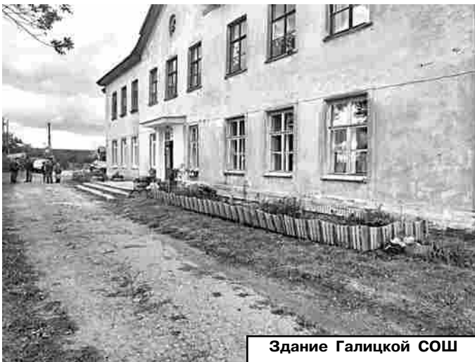
Здание Галицкой СОШ

Здание школы в п.Галицы построили в 1951 году. За 70 с лишним лет эксплуатации капитального ремонта требуют крыша, фасад здания, фундамент, канализация, система отопления, т.е. практически все системы жизнеобеспечения здания. Все они вошли в смету ремонтных работ, начавшихся в августе 2022 года. Другими словами, на выходе школьники получат совершенно другую школу: полностью обновленную, уютную, располагающую всеми необходимыми условиями для обеспечения комфортности обучения.