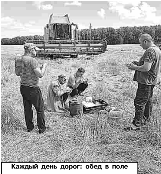
Каждый день дорог: обед в поле