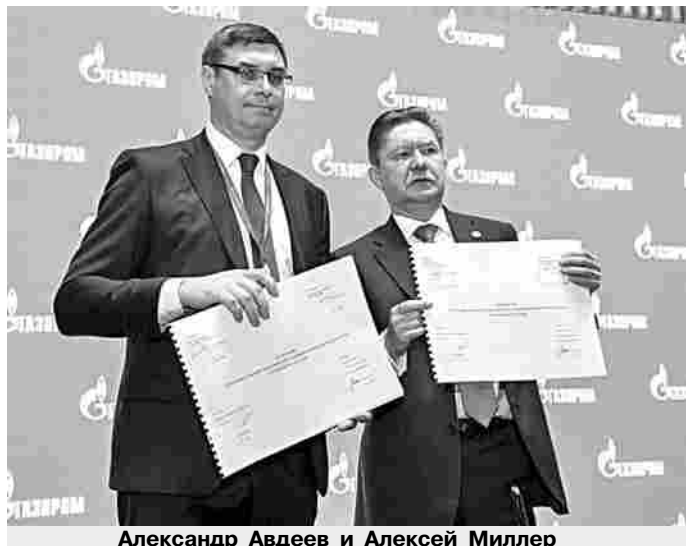
Александр Авдеев и Алексей Миллер

Об этом 17 июня на Петербургском международном экономическом форуме договорились глава региона Александр Авдеев и председатель Правления ПАО «Газпром» Алексей Миллер.