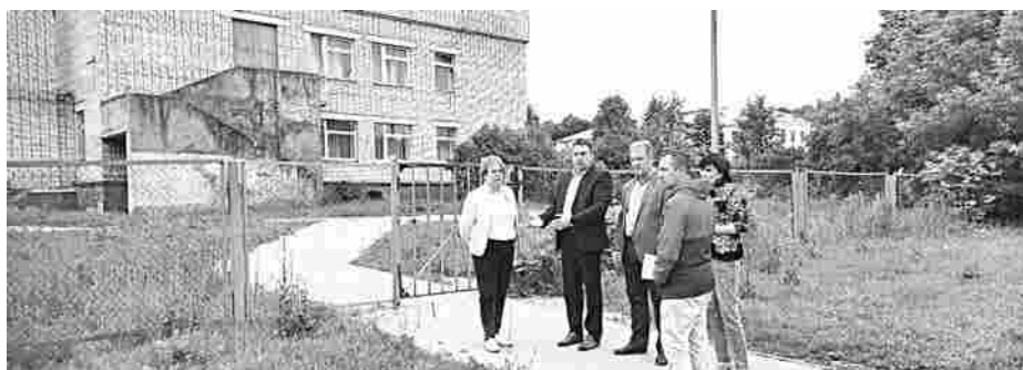
В планах администрации - благоустройство общественной территории возле школы №3

О благоустройстве городской территории и реализации заключенных контрактов по ремонту дорог в Гороховце,