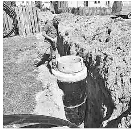
Работы на водопроводных сетях в п.Чулково

Еще одна проблемная для региона тема – борщевик. В нашем районе она тоже стоит остро. На планерке обсудили проведение работ по обработке территорий и связанные с этим проблемы (подробности на 6 стр. номера).