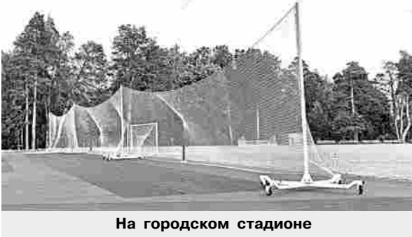
На городском стадионе