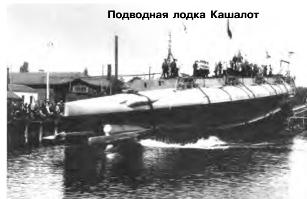
Подводная лодка Кашалот