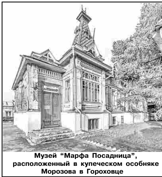
Музей «Марфа Посадница», расположенный в купеческом особняке Морозова в Гороховце

Учитывая, что по чертежам В.Г.Шухова баржи-гиганты до революции строили только две верфи (Гороховецкая и Мордовщиковская), место производства таких судов можно «вычислить», опираясь на сохранившиеся матери-