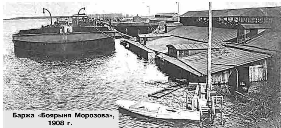
Баржа «Боярыня Морозова», 1908 г.

Пик их производства пришелся на 1909 – 1911гг. Верфи, строившие крупные речные наливные суда: Гороховецкий котельный и судостроительный завод И.А.Шорина (основан 22 октября 1902, выпуск гигантских барж с 1905 г.) и Мордовщиковская судовой верфь (позже Навашинский судостроительный, ныне ОАО «Окская судовой верфь»), которая была заложена 1 октября 1907 г. в урочище Мордовщик на Оке под Муромом, а выпуск гигантских барж начала с 1908г. История этой верфи тесно связана с Гороховцом, так как основу её квалифицированных рабочих составили выходцы из гороховецкого уезда и непосредственно с завода И.А.Шорина.