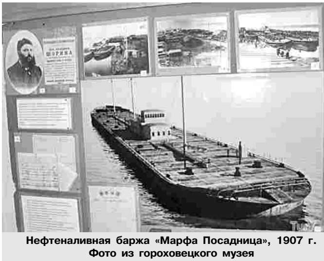
Нефтеналивная баржа «Марфа Посадница», 1907 г.

алы по выпуску барж на Мордовщиковской верфи, в разбросанных по книге Шубина упоминаниях об этих гигантах, в некоторых случаях на сайте «Водный транспорт». Если в архивной истории Мордовщиковской верфи данное судно не упоминается и отсутствуют его известные фотографии, то местом его производства с высокой степенью вероятности является верфь И.А.Шорина. Подтверждением версии служит и отсутствие качественных фотографий таких судов (заказчики в Мордовщике – это «Т-во Бр. Нобель», старались запечатлеть свои