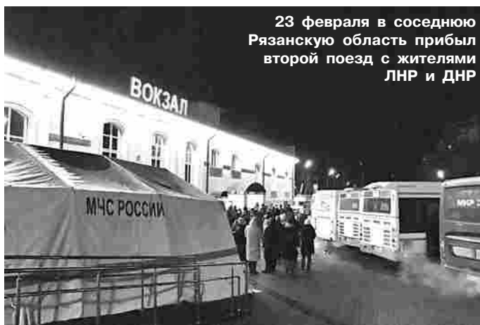
23 февраля в соседнюю Рязанскую область прибыл второй поезд с жителями ЛНР и ДНР