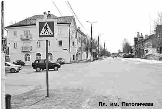
Пл. им. Патоличева