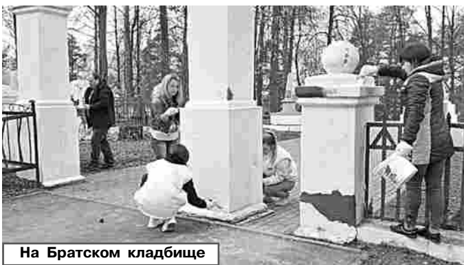
На Братском кладбище

В п.Пролетарский таблички с именами и фамилиями погибших участников Великой Отечественной войны были обновлены в предыдущие годы. В этом году будет установлена новая мемориальная дос-