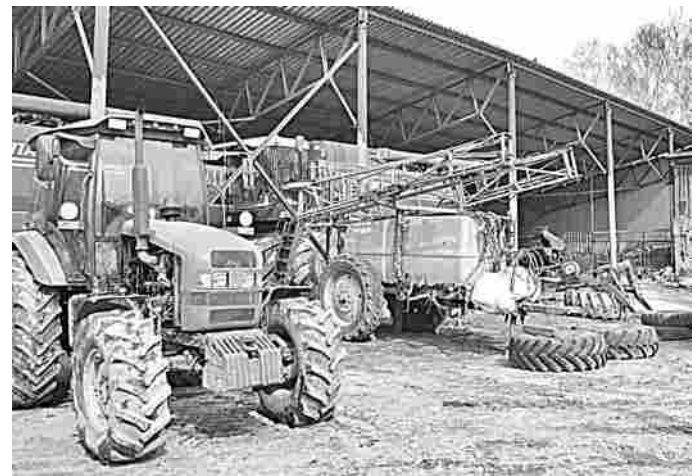
Хозяйства готовят технику к началу полевых работ.