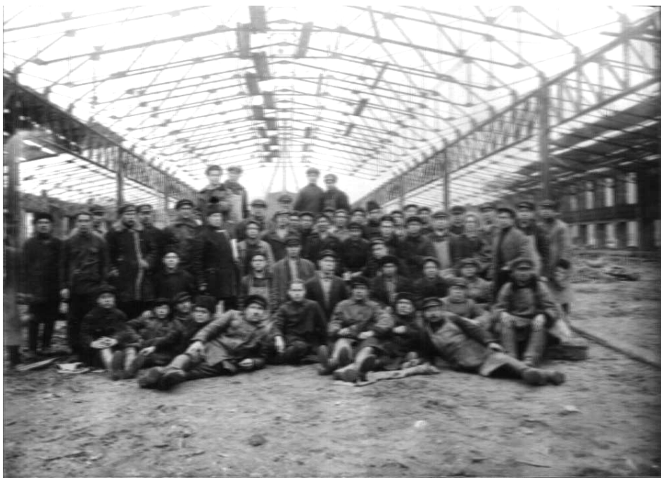
1926г. Строительство Бахметьевского автобусного гаража. Котельщики на фоне металлоконструкций

Вместе с Шуховым гороховчане работали и тогда, когда не стало процветающей фирмы, а в стране была полная разруха.