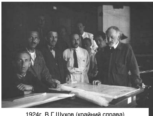
1924г. В.Г.Шухов (крайний справа) в проектной конторе

Передо мной несколько фотографий, на которых запечатлены люди, причастные к событиям в России в первой трети прошлого столетия. На любительском снимке несколько человек в костюмах, характерных для 20-ых годов прошлого века, возле чертежного стола внимательно смотрят в объектив