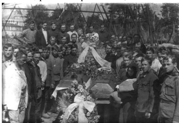
Июль 1921г. Похороны погибших при аварии Шабаловской башни