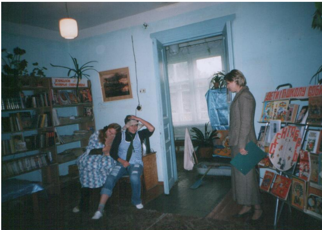
Гости праздника Лень и Бездельник