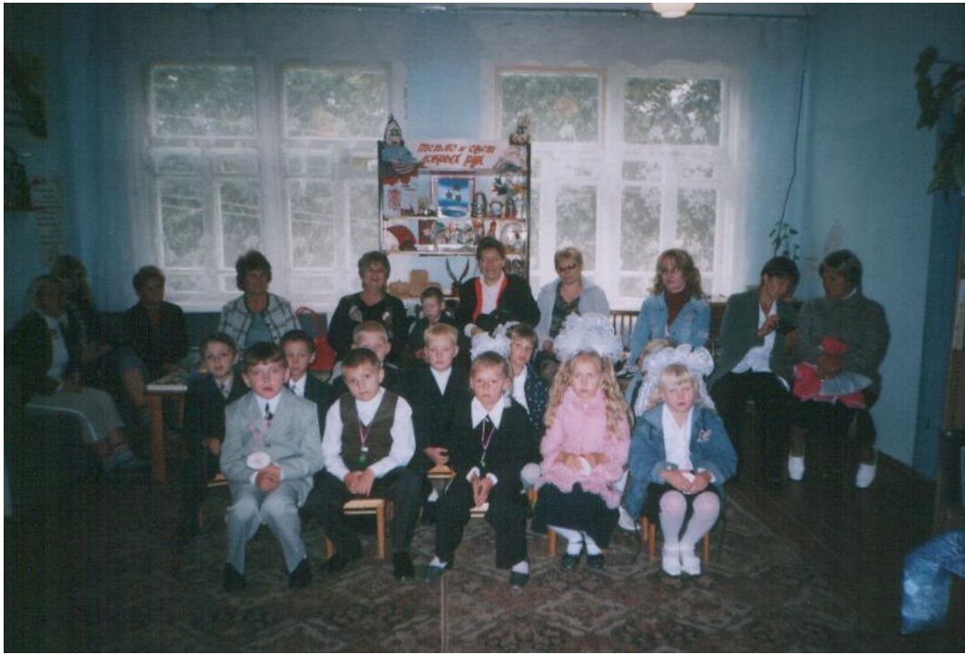
Праздник для первоклассников и их родителей «Здравствуй, здравствуй первый класс!»